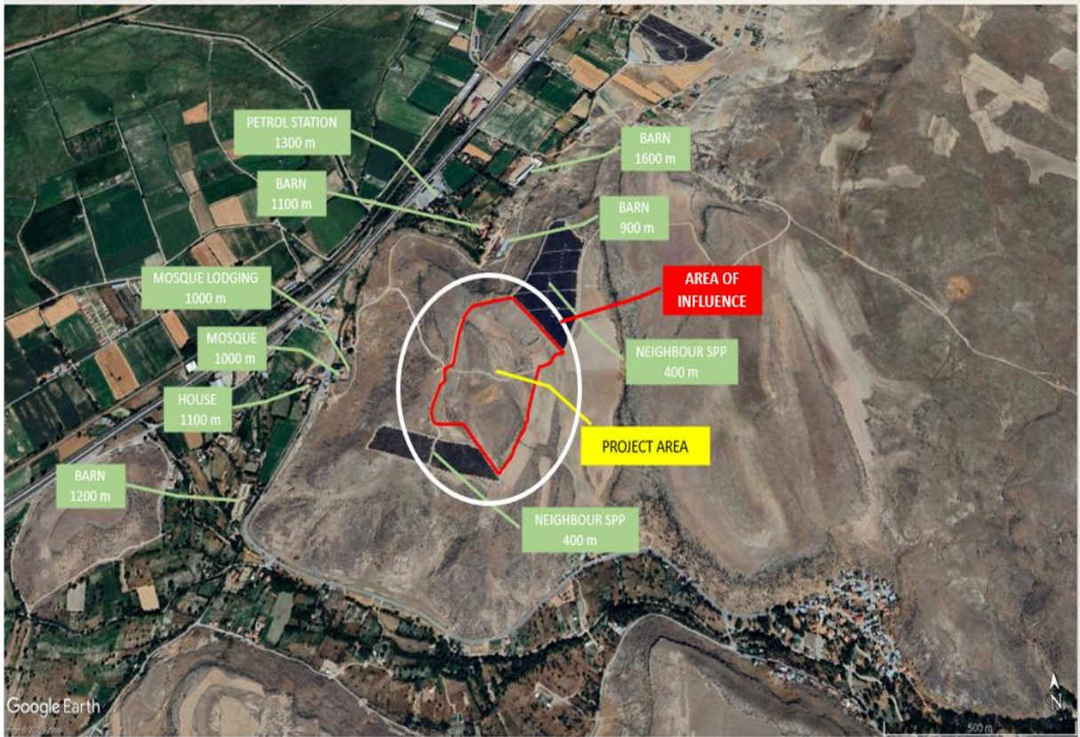
Şekil 2: Alt Proje Alanına Yakın Yerleşim Yerleri ve Tesisler Haritası

Öte yandan, alt proje sahasına yakın konumda bulunan güneş enerjisi santrali sahaları, proje faaliyetlerinden kaynaklanabilecek toz, gürültü ve trafik etkilerine maruz kalma potansiyelleri nedeniyle projenin etki alanı kapsamında değerlendirilmiştir.